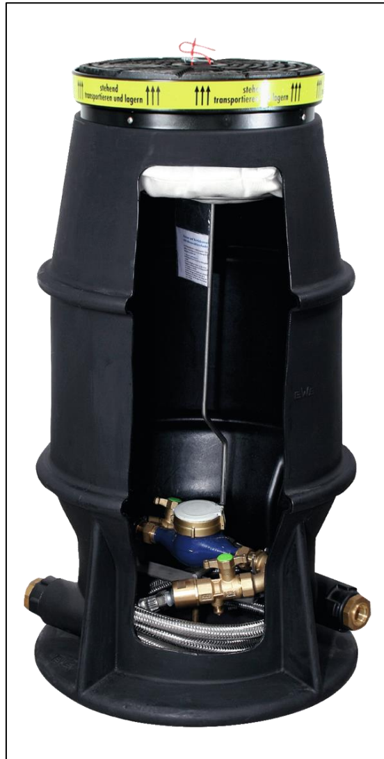
Musterschacht 2