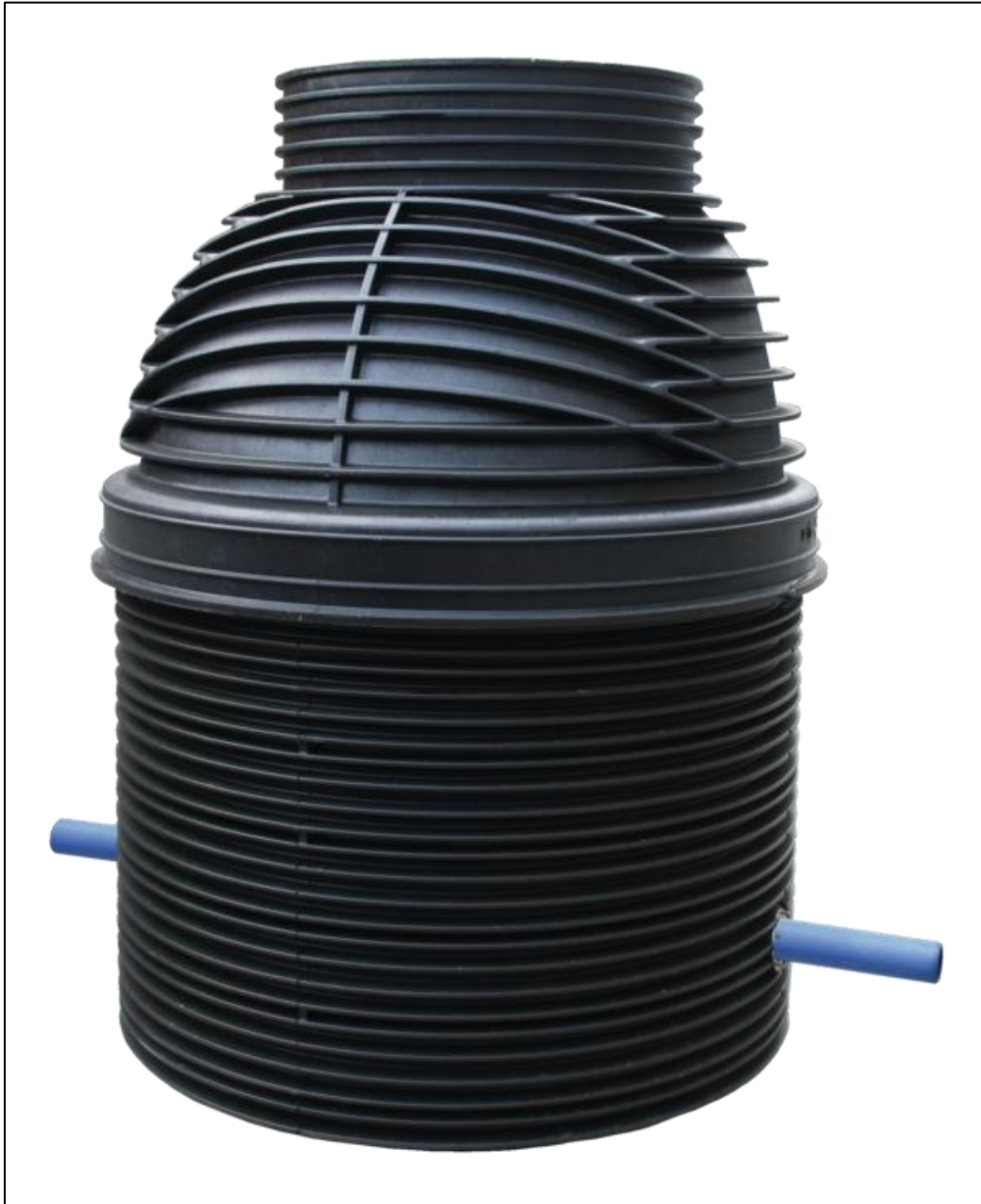
Musterschacht 1